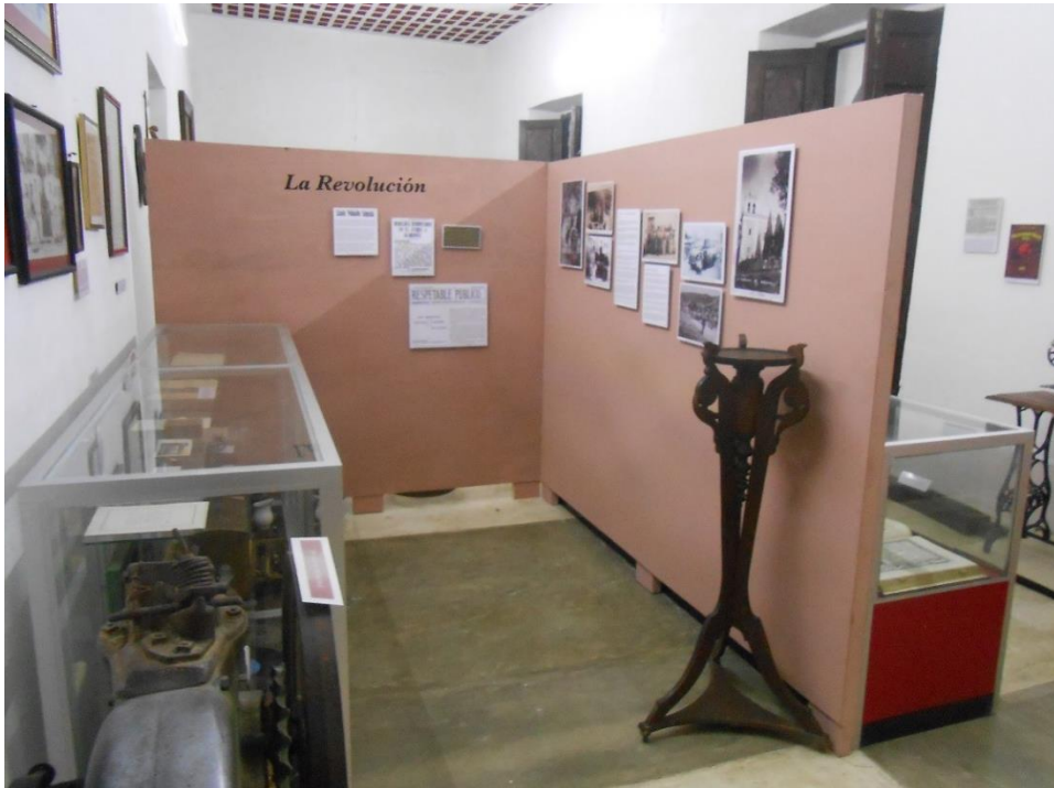
Sección 4: "La Revolución"