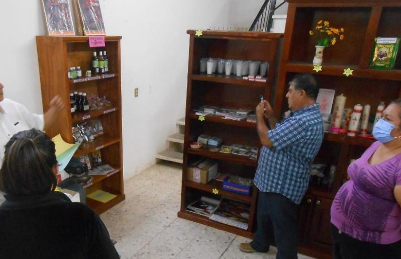
Se inaugura Casa del Túmin en la parroquia San José, de Alaquines SLP

tipo de productos o servicios religiosos, desde veladoras, biblias, rosarios... hasta la celebración de bodas, 15 años, presentaciones, intenciones y aun limosnas.